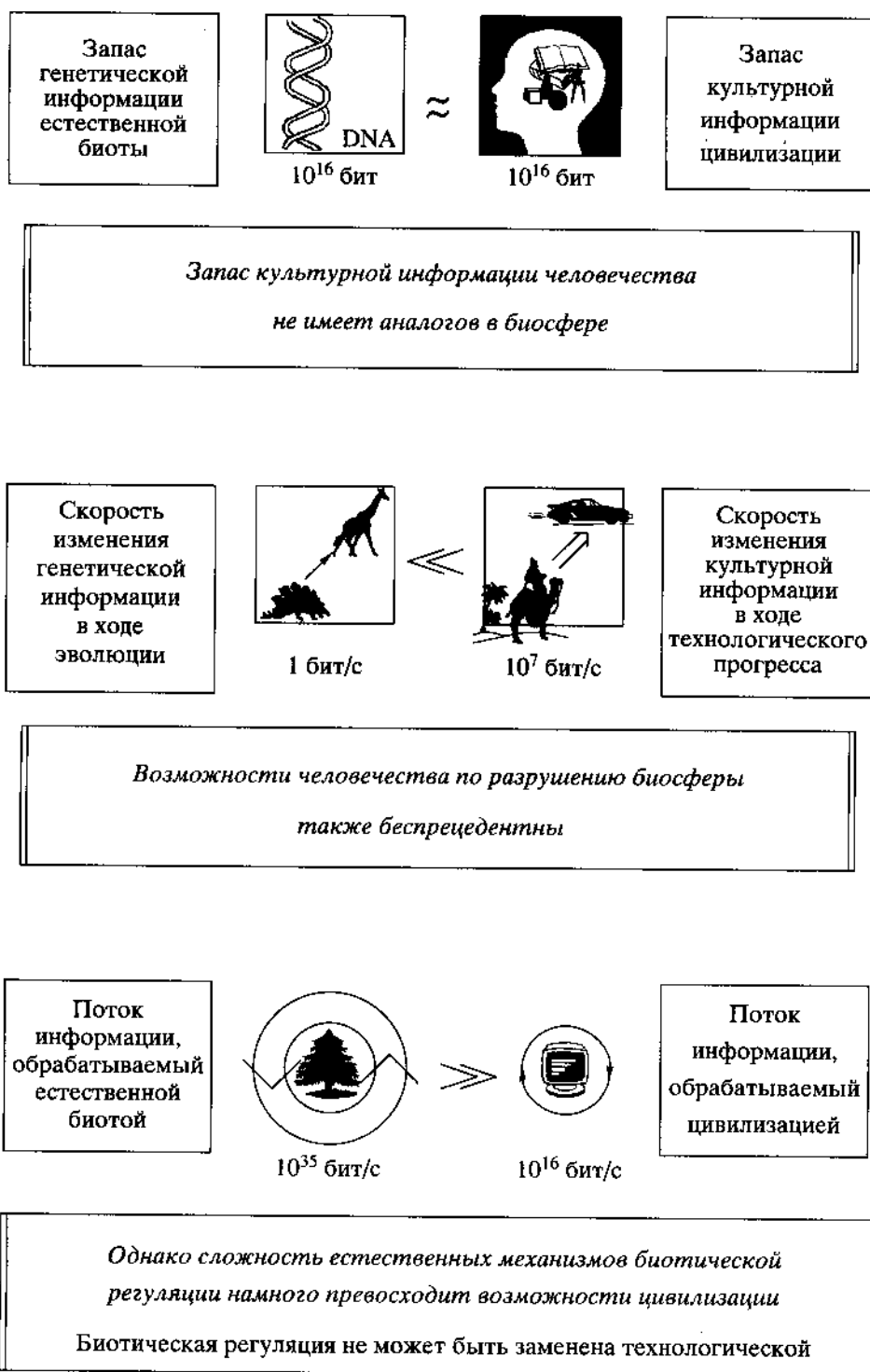
Рис. 2. Важнейшие информационные характеристики биоты и современной цивилизации.

мации вида не приводит к уменьшению конкурентоспособности особей. Белым шумом называют флуктуации, которые равномерно, случайно распределены по всем характеристикам системы подобно белому свету, в котором равномерно перемешаны все цвета радуги. Белый шум возникает в